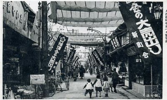
写真は「まちかどの西洋館別館」さんよりお借りしました。