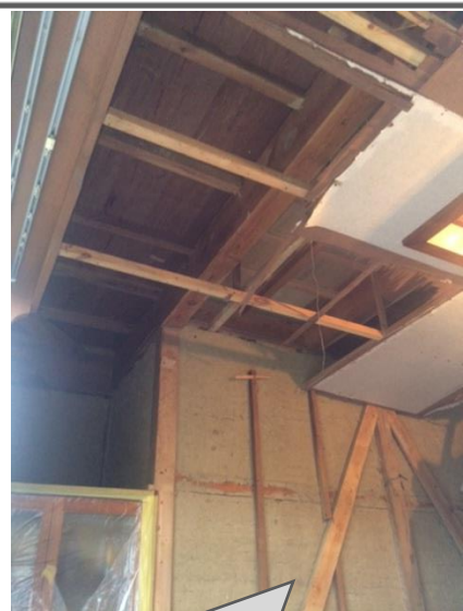
応接間リフォームでベニヤを捲いたら土壁出現！