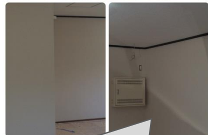
事務所の改修工事完成で見違えるようになりました。仕事の効率アップ間違いなし！