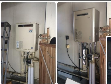
ガス給湯器を最新のエコジョーズに取替！ これでガス代が安くなります(^ ^)v